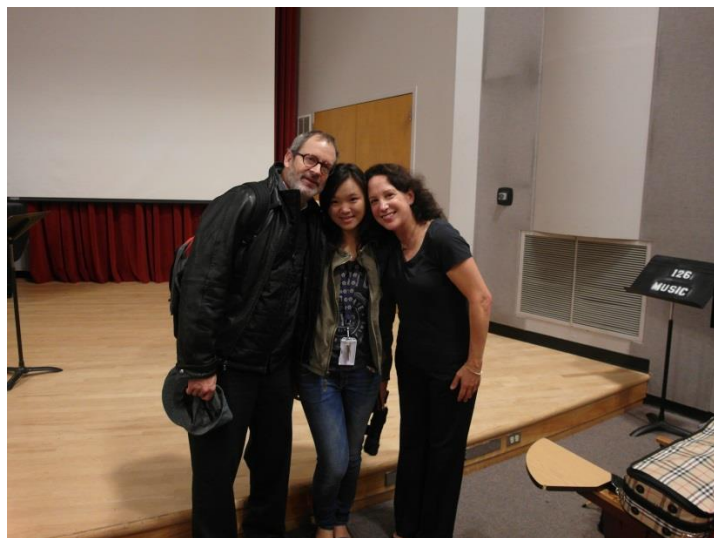
(左)教授 (中) 我 (右) 西雅圖交響樂團小提琴首席

該課程內容主要為音樂史、流派和音樂家的介紹和作品欣賞，學期成績則依據平時考、期中期末考和兩場音樂會心得來評分。