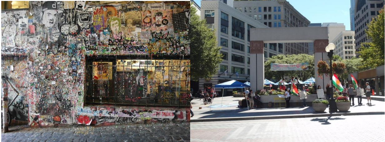
左圖:有名的 GUM WALL

從 UW 搭公車 20 分鐘即可抵達的 Downtown Seattle 絕對是交換日子裡最常去的地方，博物館、音樂廳、百貨公司、大型商場等等應有盡有的活動場所，走路十分鐘就可抵達世界知名的派克市場、世界第一間星巴克，簡單說就是個繁華的熱鬧商業觀光區。