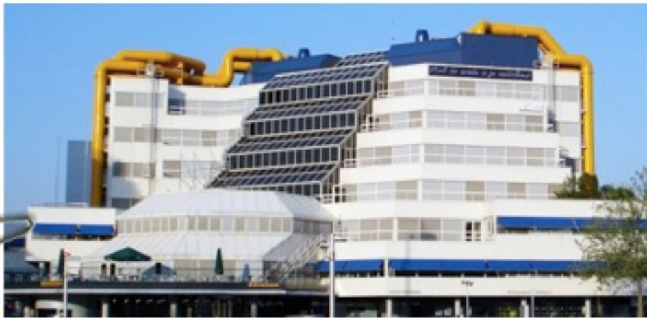
ROTTERDAM PUBLIC LIBRARY