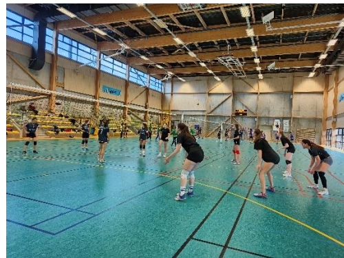
左圖為在昂傑看球賽、右圖為跟 ESSCA 女排去南特比賽。