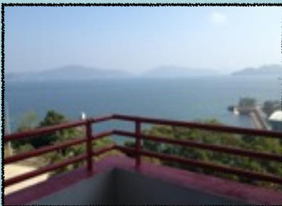
Hall III的陽台。看出去是很美麗的海景。