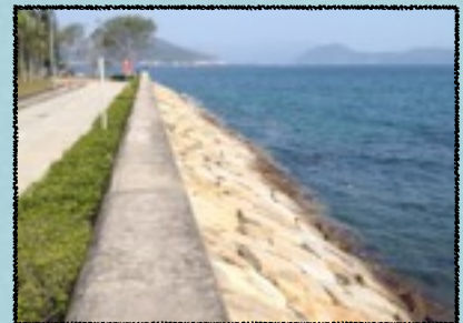
最舒服的Pier，晚上星光燦爛，迎著微風聽著海浪拍打