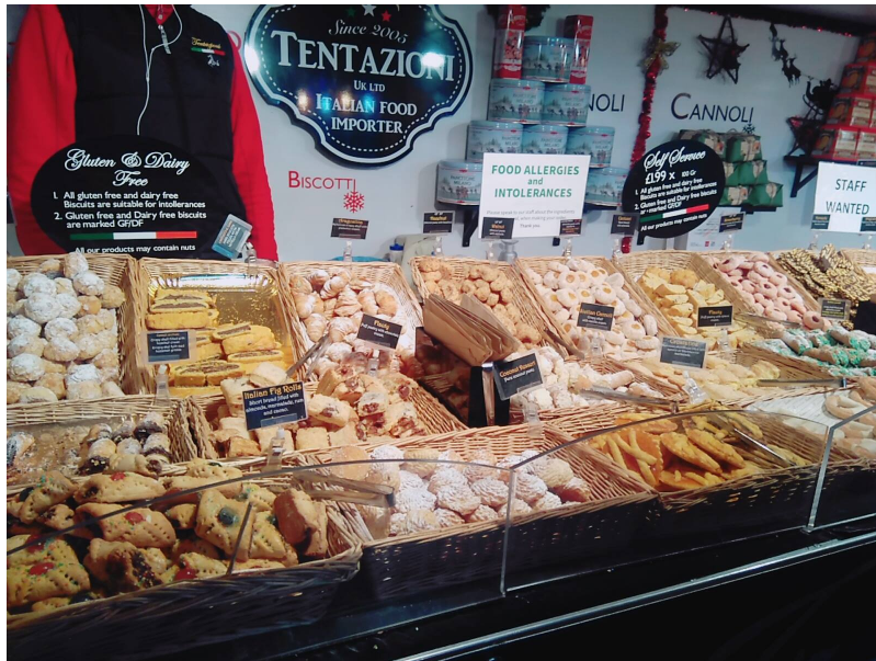
▲▼ CHRISTMAS MARKET 一隅