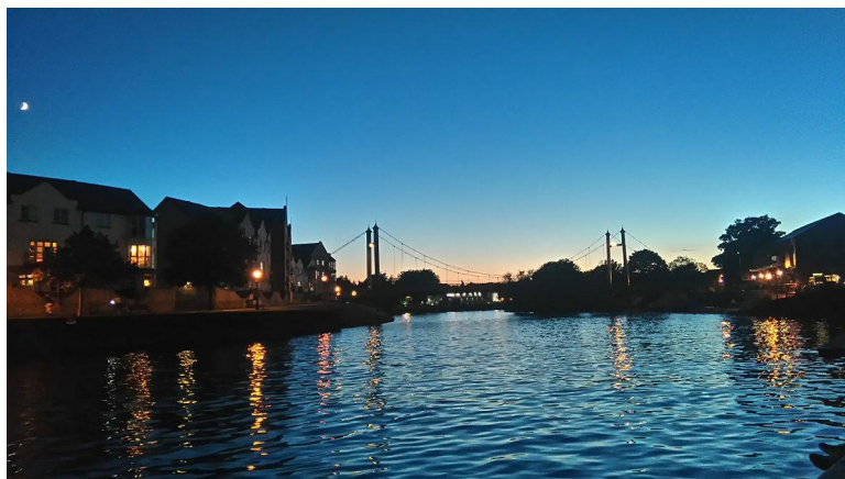
▲▼ THE QUAY 風景