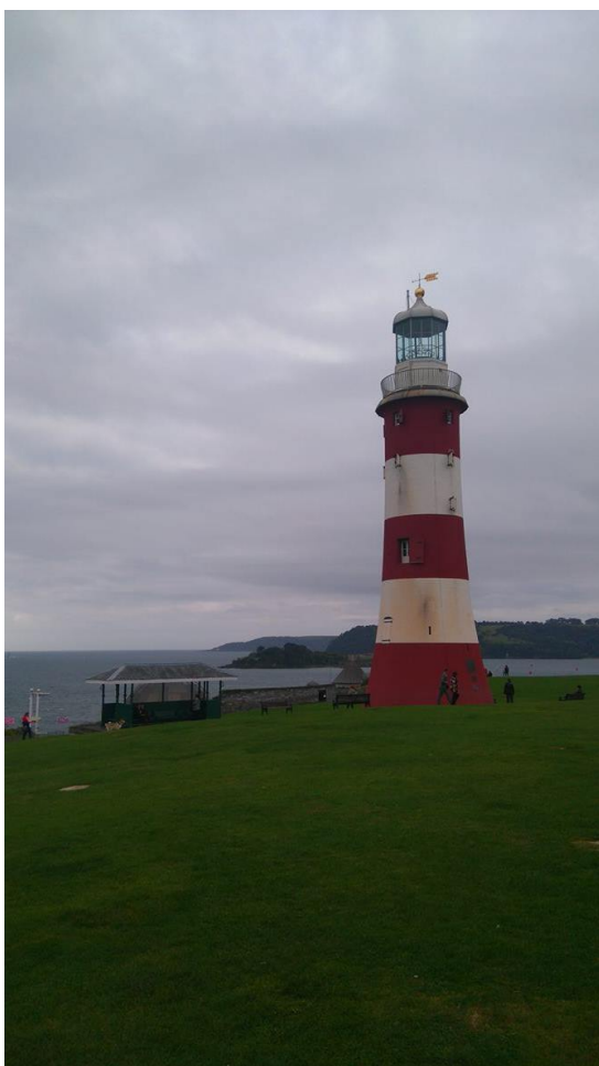
▲ PLYMOUTH 燈塔

EXETER 是一個離海邊不遠的城市，附近有幾個大港口，在航海時代是貿易據點之一，周圍也有一些可以在一日來回的海港城市適合在周休二日出去走走，例如 PLYMOUTH 或 EXMOUTH 等等；在距離市中心不遠的地方也有河岸，會有很多人在慢跑或划船等等，偶爾也會有些攤販市集，很適合去散散步。