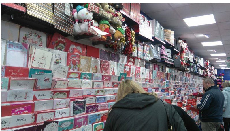
▲市區會有很多賣卡片和禮物的店